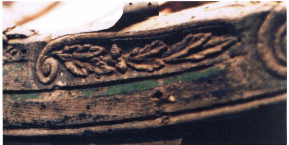
Bonte Vogel. Fries Scheepvaartmuseum Sneek