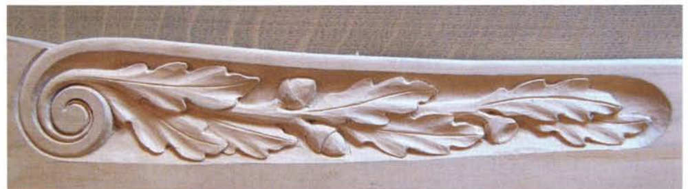
Eikenloof naar Bonte Vogel, eigen werk.