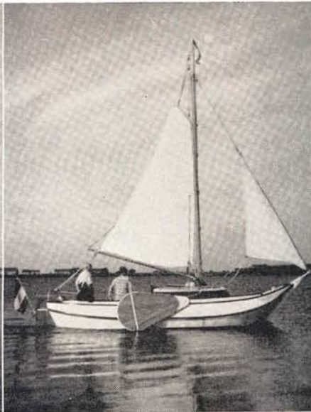
Stalen grondel-jacht Wanda .