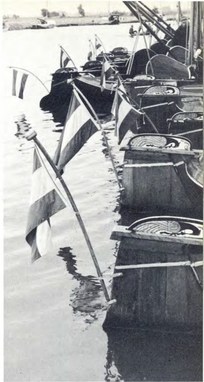
Een deel van de tjottervloot van de jeugherberg in Heeg

scheepje. Een soort bestelwagentje, maar dan op het water.