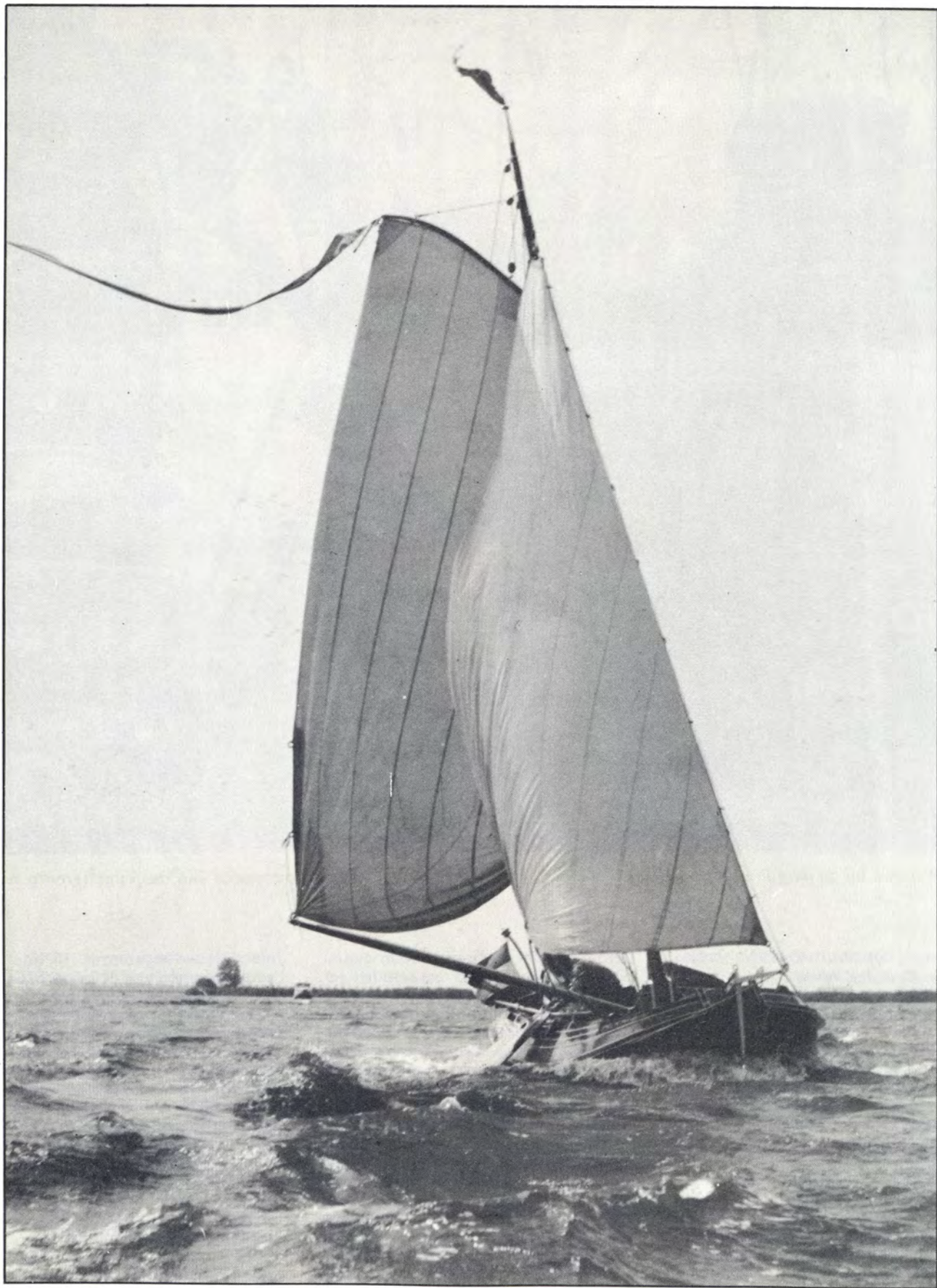
Heit Piersma blies in zijn eentje de tjotter nieuw leven in