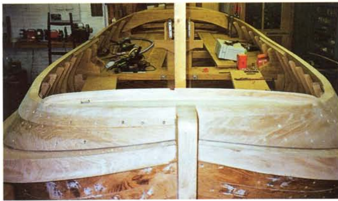
De afwerkfase van de romp.