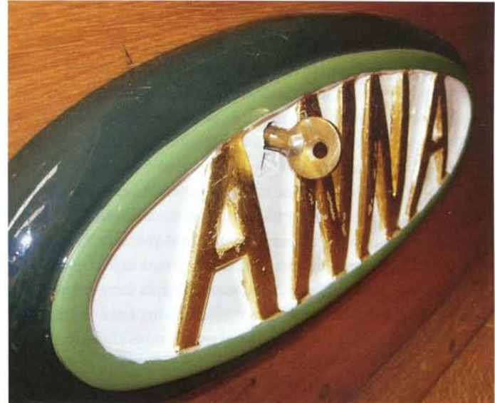
Het naambordje Anna, in bewerking (links) en klaar.