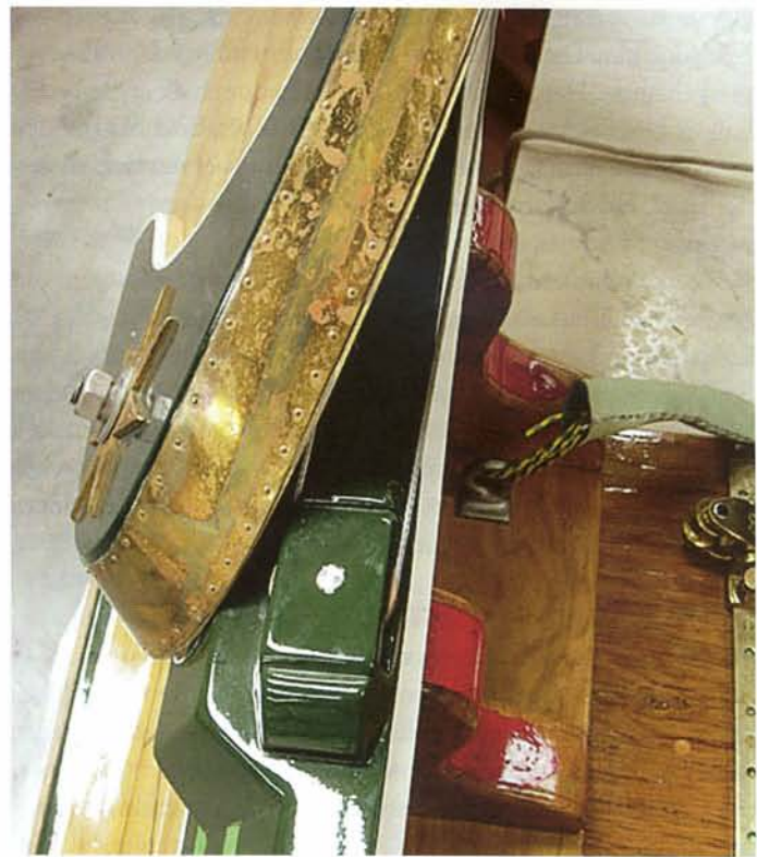
Het zwaard is gemonteerd, let op het gemarmerde bankje.