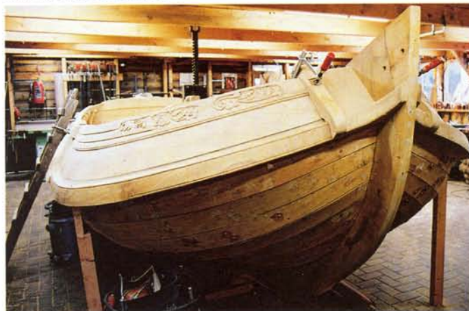
De romp is bijna klaar. Augustus 2003.