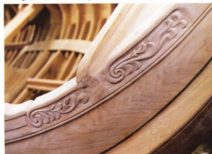
Het lofwerk is gesneden.

beter bij het hout en zo vallen de stops minder op. De lijm zet uit en gaat rond de schroef zitten, waardoor er geen vocht bij komt.