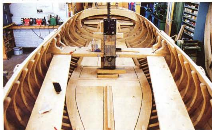
Erik begint met het interieur, augustus 2003.