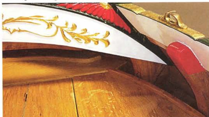
De bedelbalk wordt afgewerkt, let ook op de rode kleur.