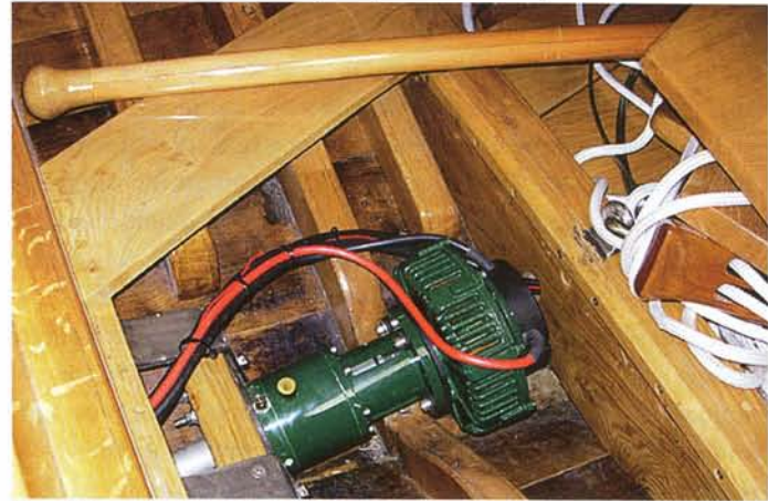
Een elektromotor wordt (bijna onzichtbaar) ingebouwd.