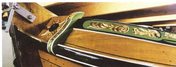
Het bladgoud is aangebracht.

De motor, de regelkasten die de elektronica aansturen en de accu's moeten onzichtbaar weggewerkt worden. De motor zelf komt