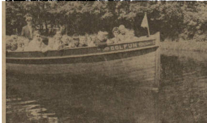
Wiep Visser met een groep enthousiaste kinderen in de Dolfijn het meer op, juli 1965.