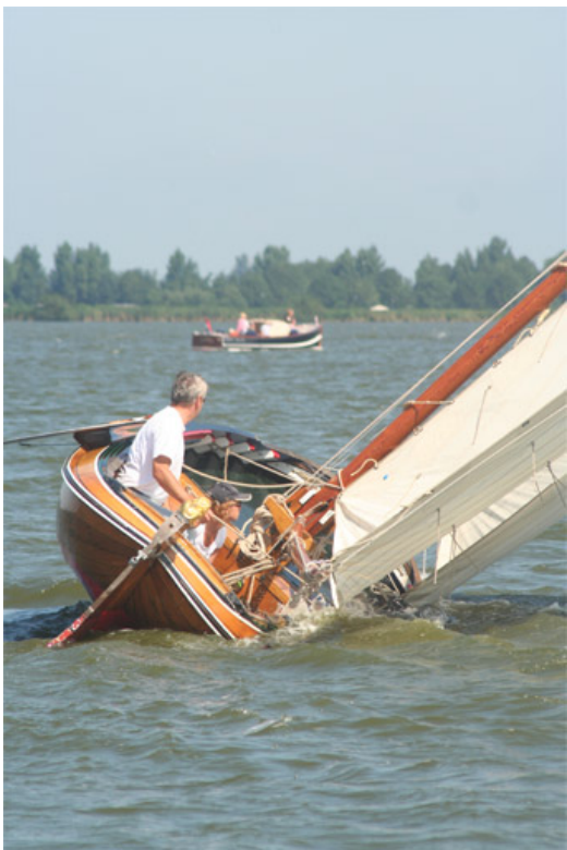
Poseidon 2006 in wedstrijd ( www.friesereunie.nl ) Let op het bijna horizontaal liggende loefzwaard.

De Poseidon is een snel klein Fries jacht. Onder water heeft ze een prominente piek. Haar dwarsdoorsnede benadert een S-spant vorm. Al in haar jaren op het Paterswoldsemeer werd ze bewonderd vanwege haar snelheid.