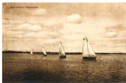
uitsnede uit oorspronkelijke foto die ook als ansicht is uitgegeven.