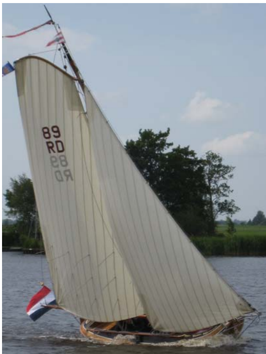
2009 wedstrijd Oostergoo. Met het smalle tuig en "rood" nummer.