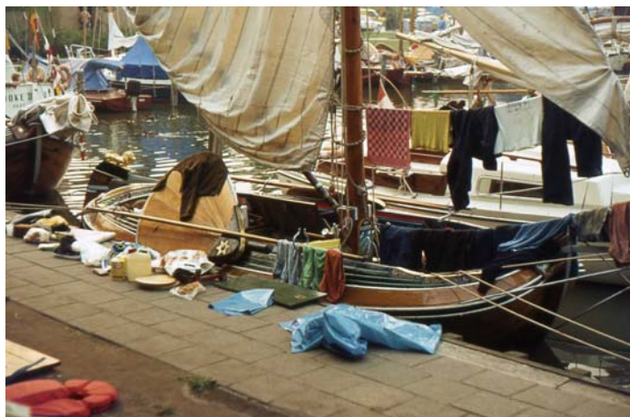
Kleren drogen na de wedstrijd. Poseidon ca.1980 Retnie Heeg. Dia GtC.

Een belangrijke reden dat ik voor een Fries jacht heb gekozen is omdat de familie Pels elk jaar tweemaal voorbij kwam met een Fries jacht..... Ik woonde aan de IJssel bij Zwolle. Hoe zij het elke keer weer voor elkaar kregen zeilend een kribje te pikken om tegen de stroom in te komen was geweldig om te zien. Ik was er erg van onder de indruk. (d.i.Bestevaer 1953).