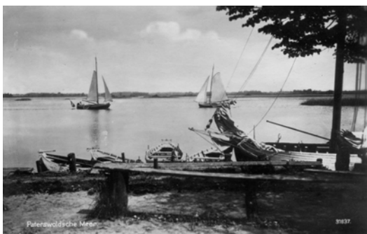
Twee ansichten in een iets gewijzigde compositie. Zeilend rechts de Poseidon met een sterk achterover staande mast. Foto Kramer 1915