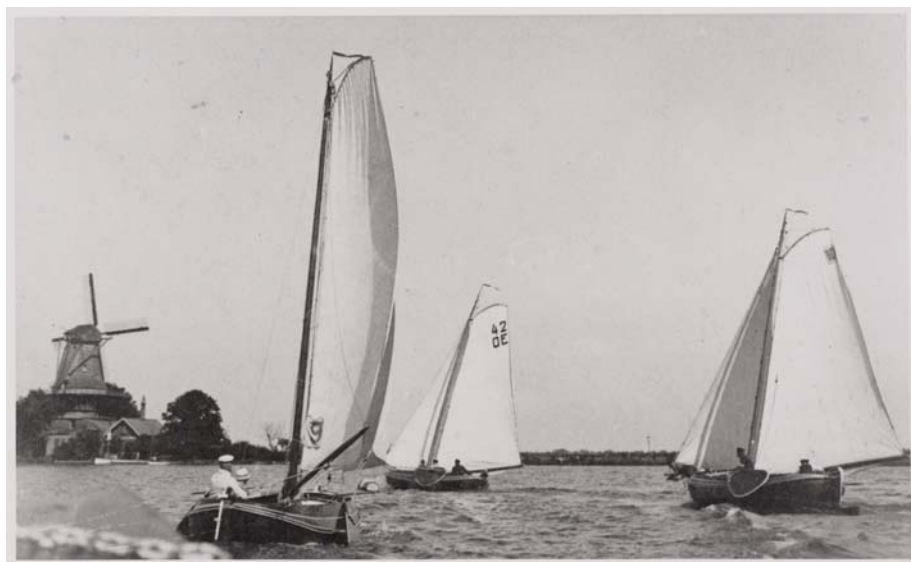
Nelly in het midden met zeilnummer 42 OE locatie en datering onbekend. Bij uitvergroting lijkt de vorm van het achterschip erg op dat van de Aeolus.