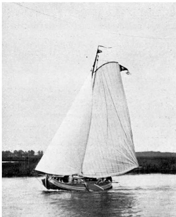
Uit Ons Element 1921 blz. 619.