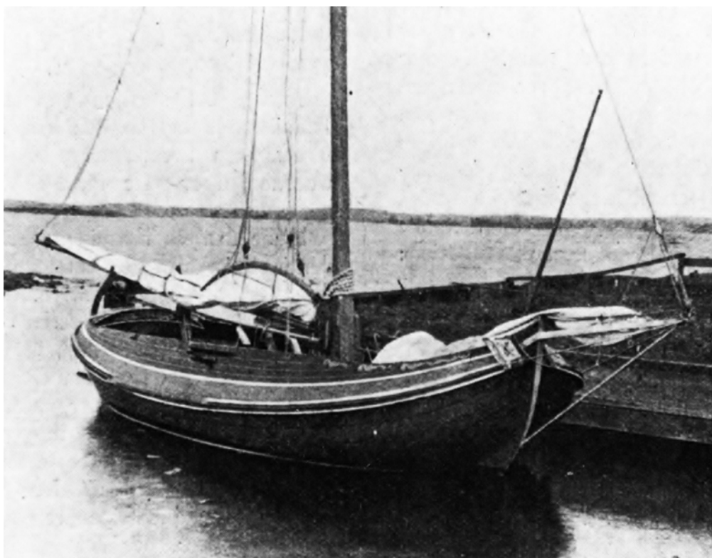
Uit: Watersport 1918-7 Nelly

In de Watersport no. 7 uit 1918 staat een foto van de Nelly zonder zwaarden. De fok en grootzeil zijn aangeslagen. Wanneer de schoonheid van een Fries jacht geïllustreerd moet worden, komt deze foto bij mij boven aan de lijst te staan. Zonder andere Friese jachten te kort te willen doen zijn schoonheid en evenwichtigheid hier zoals het naar mijn idee moet zijn. Een poging om de Aeolus in 2010 vanuit dezelfde positie te fotograferen is niet goed gelukt. Een één op één vergelijking is hier niet mogelijk.