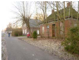
Op het bord de tekst: Te huur Zeil en Roei Booten A.Helder toen aan de Kunstweg, in 2011 Meerweg.