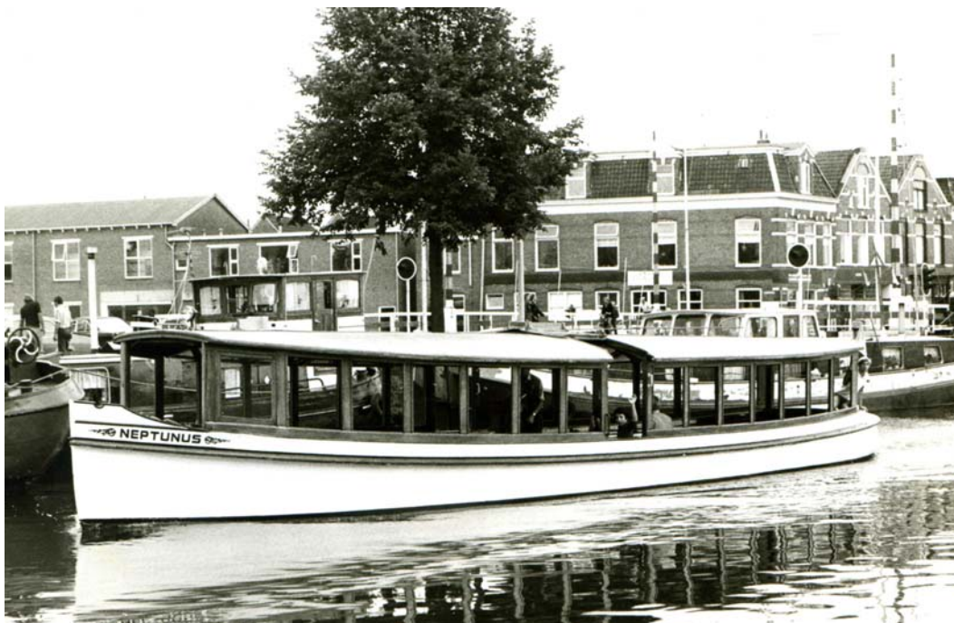
Ca. 1975 Bij de Eelderbrug in Groningen. In 2010 is haar uiterlijk nog ongewijzigd.

Het Nederlandsch Jachtregister 1924/25 geeft een overzicht van de in Nederland rondvarende jachten op dat moment. Het is niet compleet en er staan fouten in, maar het geeft wel een goed overzicht van de varende watersport toen. De naam van de Fa.W.Visser en Co te Haren C48 komt vaker voor. Uit het jachtregister is af te leiden hoe de verhuurvloot van Visser er anno 1924 heeft uitgezien. Een opsomming in alfabetische volgorde: