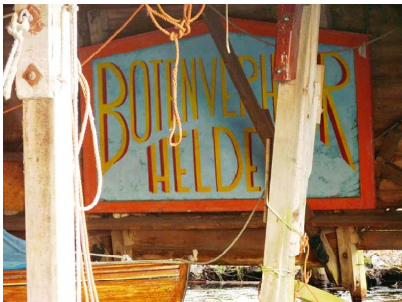
Foto GtC 2011 In het nog bestaande niet meer bruikbare botenhuis van Helder. De Poseidon had hier haar ligplaats.

Uit overleveringen van Jaap Helder (1907) is bekend dat het eikenhout dat gebruikt werd voor de botenbouw, afkomstig was van bomen uit de omgeving. Deze moesten door hen zelf worden gekapt. Ze hadden geluk wanneer de wortels in de grond mochten blijven zitten. Op de werf waren stoomvaten aanwezig, waar het hout overheen werd gelegd om het te kunnen buigen. Vaten en planken werden tijdens het stoomproces afgedekt met doeken om de warmte niet verloren te laten gaan. Het buigen was daarna een actie die snel uitgevoerd moest worden omdat het hout anders te snel afkoelde. Natuurlijk werd er ook hout ingekocht. Zo werd er ook ceder, lariks en mahonie verwerkt.