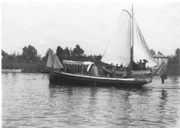
Waterfeest 1910 “tjotter met twintig man aan boord” dit is de “Eeltje”.