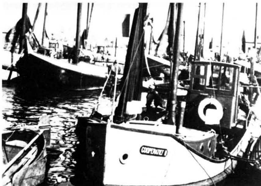
Moerdijk, kort na de oorlog, de haven vol vissersschepen op de voorgrond, de visafhaler van de coöperatieve visafzetvereniging.

deeld over 50 boten wordt gevist. Vooral dit aantal boten schijnt aanmerkelijk groter te zijn dan 10 jaar daarvoor, terwijl ook nog met tal van niet in dit aantal opgenomen boten wordt gestroopt.