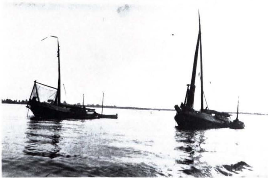
Twee schokkers met gehesen kuil op het Hollands Diep. Bij de ankerkuiler links is goed te zien hoe het raam in zijn geheel loodrecht op de stroom uit water is gehesen

aan aas voor de kubben. Dit kon weliswaar gevangen worden beneden de lijn Goeree-Rockanje (dit gebied werd als vrije zee beschouwd) maar dat kon ver weg zijn van de plaats waar de kubben lagen. Sommige schokkers visten dan in „compagnie” enkele schokkers visten met de kuil op aas beneden de lijn Goeree-Rockanje, een schokker vervoerde het aas en een derde groep vissers viste met de kubben. De totale opbrengst werd verdeeld. Het zoutwater-aas voldeed echter minder goed in zoet water. Vooral als een man zijn kubben van zoetwateraas voorzagen, waren de anderen sterk in het nadeel. Bovendien kon het bij enige wind aan Rockanje vrij slecht zijn.