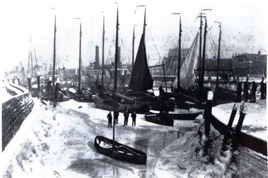
Winter 1928/1929 de Moerdijkse vloot ingevroren in de haven

om op hun perceel te laten vissen en omdat de vissers die in de gesloten tijd op zee vissen volgens een wet uit 1881 een van het eerder genoemd nummer afwijkend zeenummer moesten voeren, ontstaat een werkelijk komische nummerverwarring waarbij opzet van de vissers niet uitgesloten mag worden. Toch wordt met de ankerkuil in 1896 al veel minder gestroopt, niet in de laatste plaats omdat de overheid dan inmiddels met een botter en een hoogaars regelmatig surveilleert. Met kubben wordt wel op grote schaal gestroopt, maar niet zo zeer door de schokkervissers. Na 1896 worden enerzijds de voorschriften duidelijker – een vroeg voorbeeld van deregulering – en anderzijds de controle strenger zodat het strophen sterk vermindert. De invoering van het zeenummer voor alle vissers maakte controle om veel eenvoudiger.