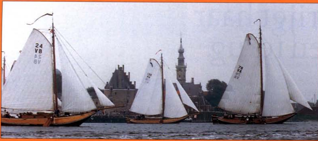
Direct na de start de Windroos voorop gevolgd door de Atalante en de Jetty