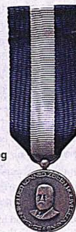
foto: De Kleine Six-penning, toegekend aan onder andere 18 jachtschippers en schippersknechten