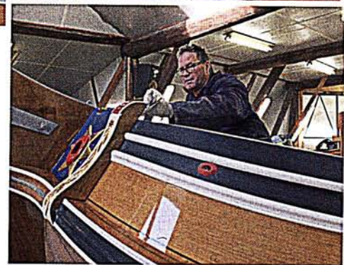
boven: De schippers van de Friso zijn druk in de weer met poetsen om het koper te laten glimmen