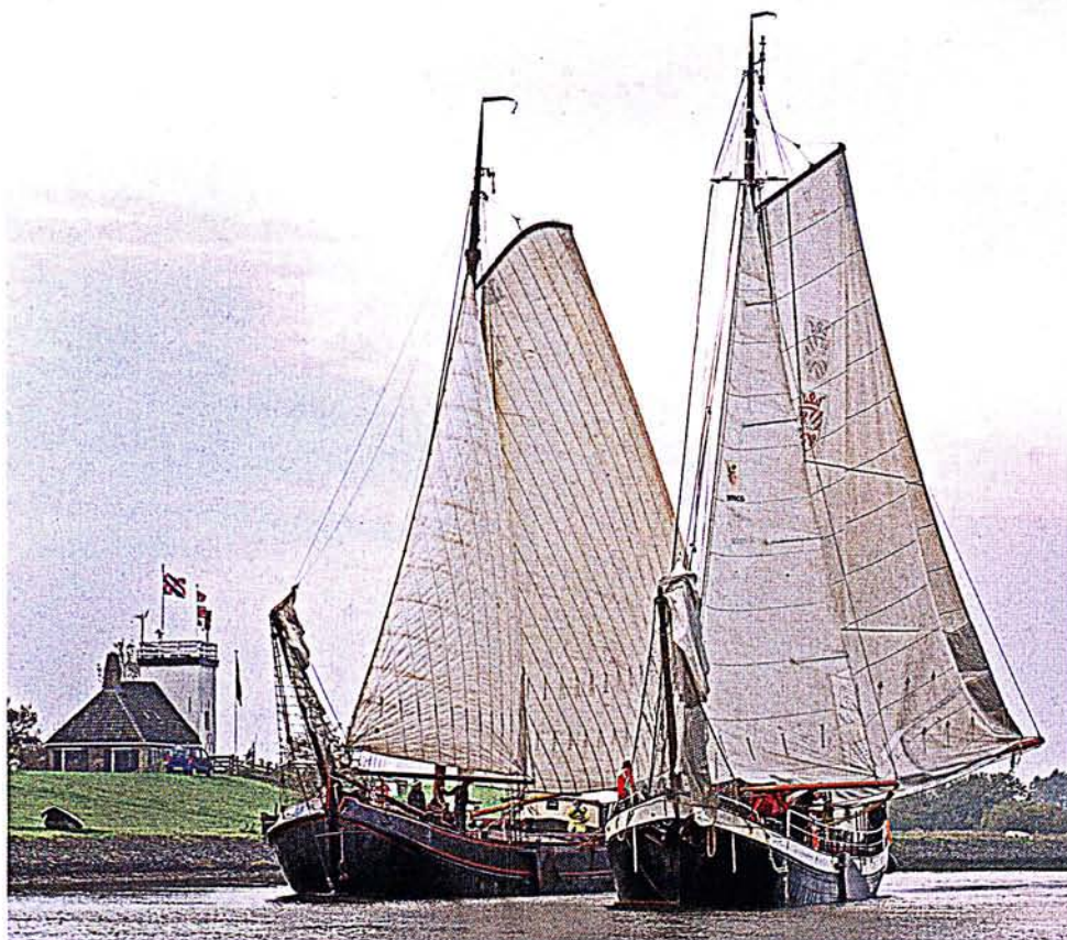
links: De tjalk naast de klipper Nicolaas Mulerius . 'Ik wil wel weer een rechte gaffel maken'

ging aan de gang en kreeg hulp. Restaureren, zorgvuldig passen, meten en buigen, dat werk lag me wel. In 1991 begon ik in Workum mijn eigen restauratiebedrijfje.'