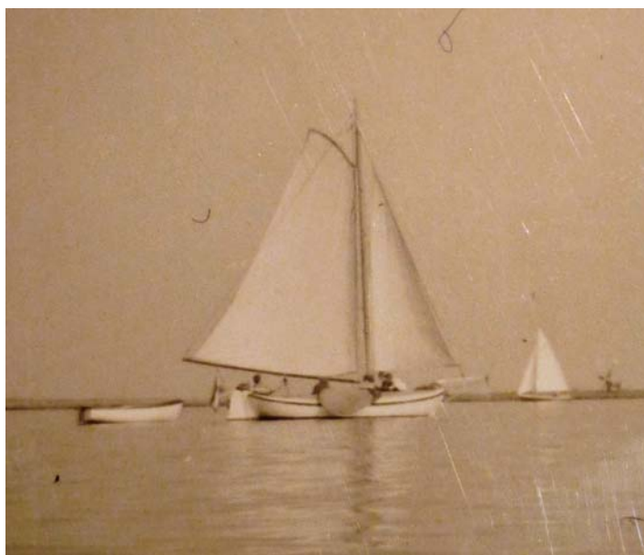
coll. Obertop. Op het Zwet. De fok wordt halverwege de botteloef gevoerd.

De heer Obertop zeilde met zijn gezin met het scheepje. Het werd gebruikt als moederschip. De kinderen zeilden met Plusjes. Nadien kocht hij voor dit doel een IJsselaak. Veel groter en met veel meer ruimte. In 2010 vaart de inmiddels 95 jarige heer Obertop nog altijd. Nu met een motorsloep. Wanneer hij “de tjotter” kocht is niet meer duidelijk. Het scheepje lag in de jaren kort na de oorlog te koop bij Jachthaven Weromeri aan het Zwet