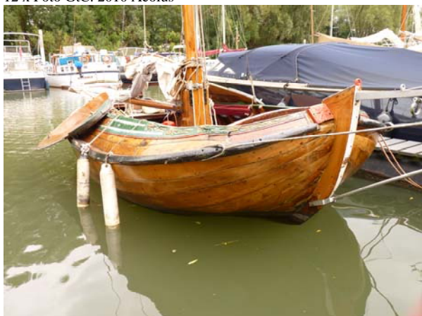
12 x Foto GtC. 2010 Aeolus

De eenvoudigste manier om te laten zien hoe de Aeolus er uit ziet is het tonen van foto's. De foto's zijn toen genomen op haar ligplaats.