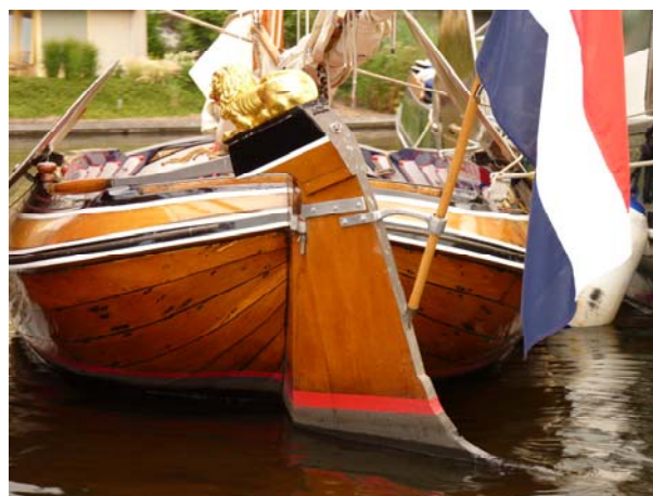
Links het achterschip van de Aeolus versus achterschip Poseidon rechts. Beide gefotografeerd in 2010.GtC.