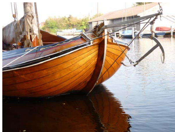
Links het voorschip van de Aeolus naast het voorschip van de Stânfries rechts. Beide gefotografeerd in 2010. GtC.