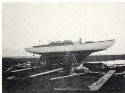
D-klasser op het droge voor een verbouwing