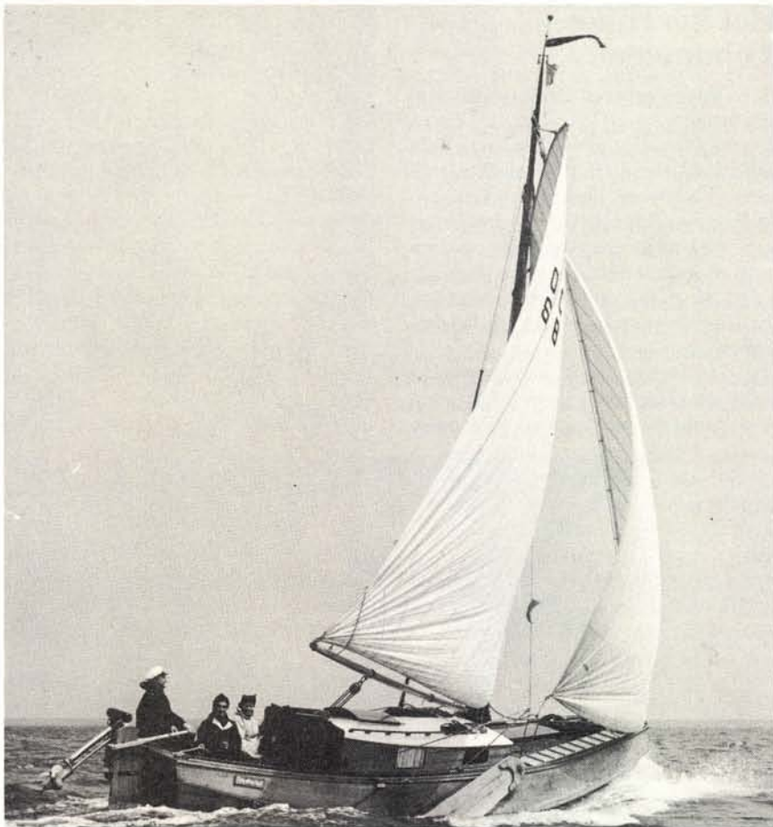
De zelf gebouwde schouw

Hij is gebouwd in een loods naast de timmerfabriek, waar mijn zoon nu in zit, maar toen hij in 1961 klaar was, zeiden vrienden 'Kerel wat zie jij er uit'. Voor mijn dochter bouwde ik er in 1965 nog een volgbootje bij, waar ze veel mee gezeild heeft. Maar ze is nu een stuk groter geworden en dat bijbootje zeilde