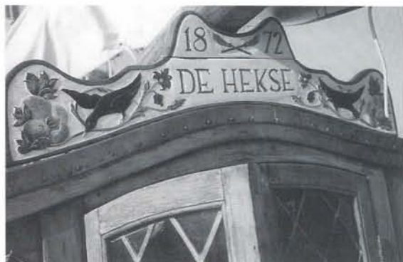
"De Hekse", kajuitfront met versierde mik.