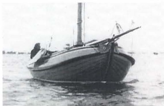
"De Hekse", vooraanzicht.