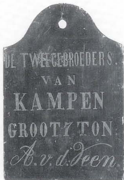
Mastbord waarmee klanten op de beurtsdienst werden geattendeerd.