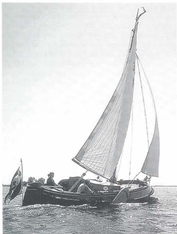
"De Hekse", onder zeil.