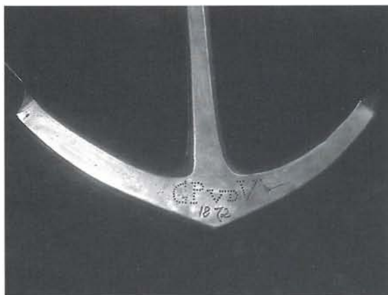
Anker met jaartal 1872 en initialen van de opdrachtgever tot de bouw van het beurtschip "De Heks".