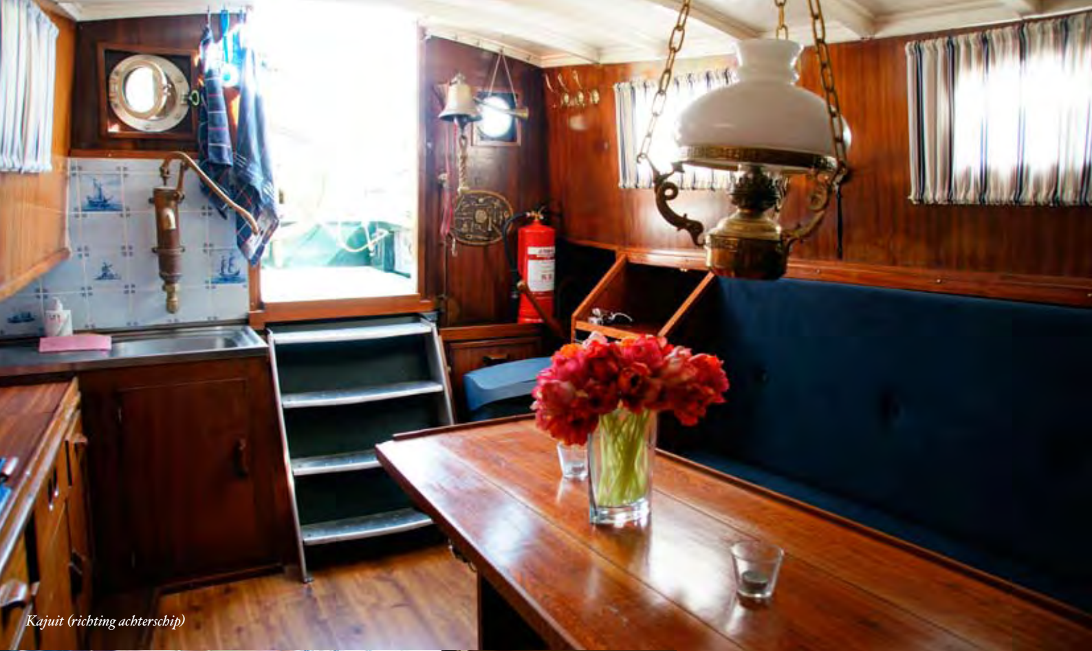
Kajuit (richting achterschip)