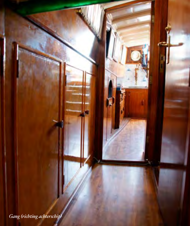
Gang (richting achterschip)