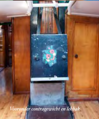
Vooronder contergewicht en lekkak