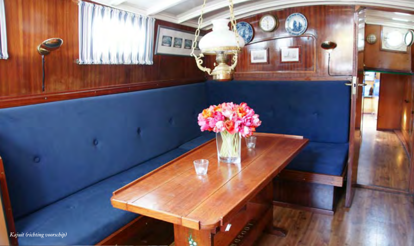
Kajuit (richting voorschip)