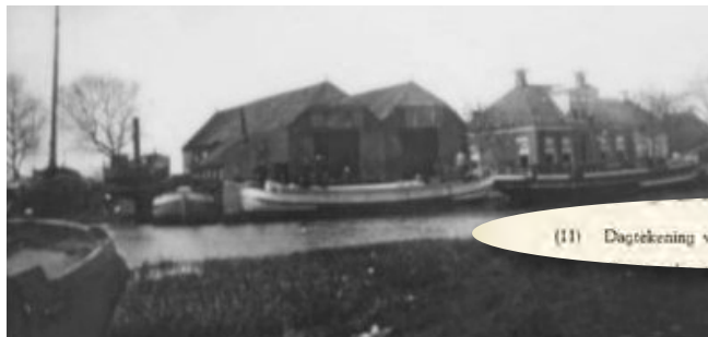
De 'Ijzeren scheepsbouw en Reparatiewerf' Gebroeders Barkmeijer'.

Inmiddels zijn we zo'n 120(!) jaar verder. Het scheepje dat ooit 't Is niet anders als eerste naam meekreeg moet alles hebben meegemaakt en heeft iedereen overleefd. Ondieptes,