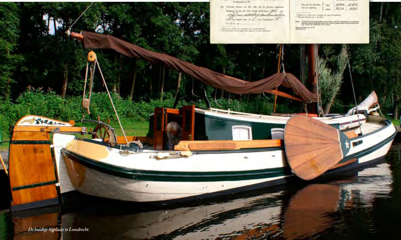
De huidige ligplaats te Loosdrecht.