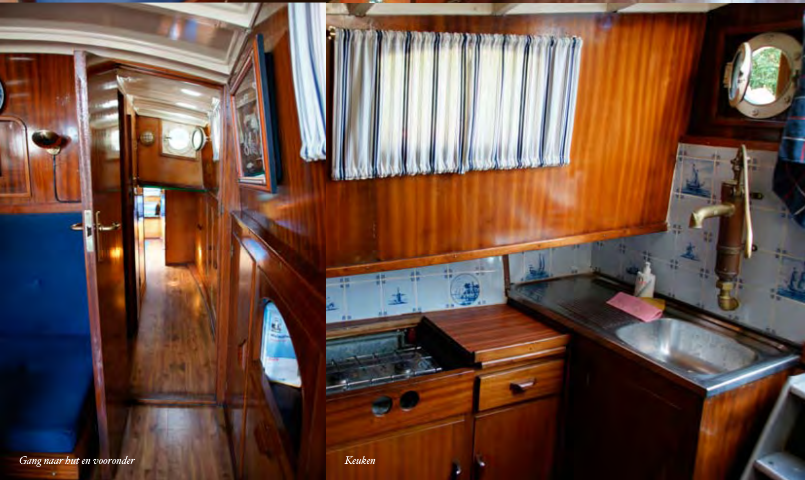
Gang naar but en vooronder