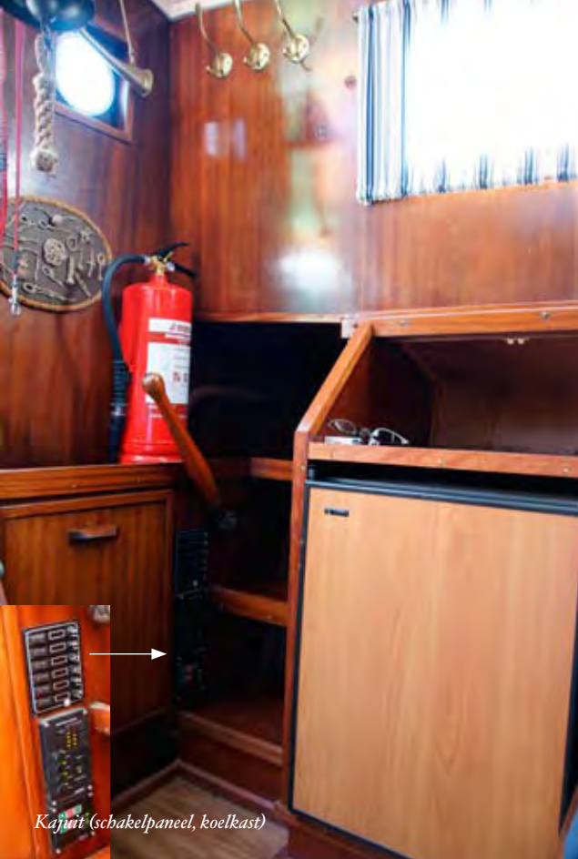
Kajuit (schakelpaneel, koelkast)