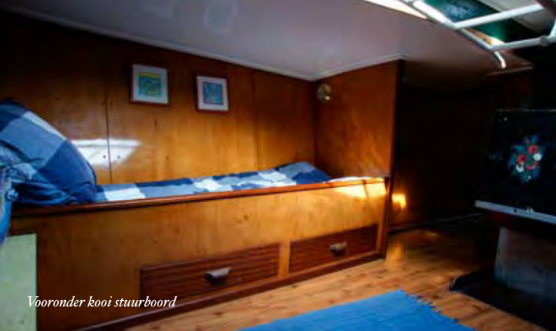
Vooronder kooi stuurboord