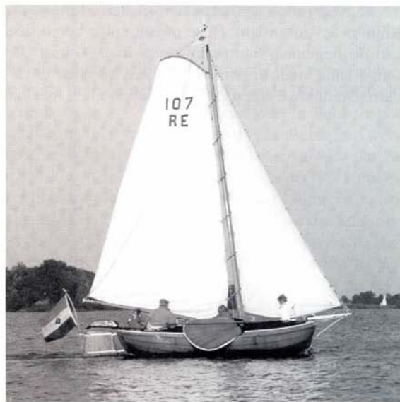
Onder zeil.