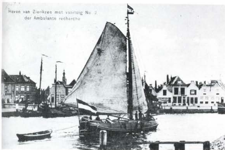
Haven van Zierikzee met vaartuig nr2 der Ambulante recherche.