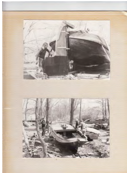
Foto geheel links: Het schip wordt geborgen na de stranding. Flinkke schade, niet alleen door de standing maar ook door de berging