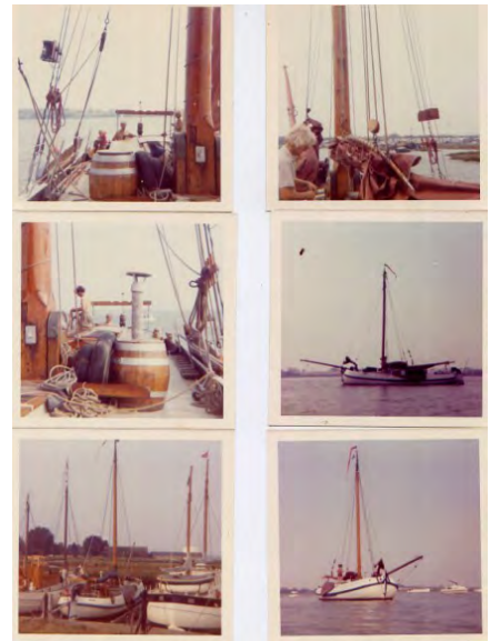
Foto boven: Afbeeldingen vande Vabel tij-dens de reizen van Giles Col-chester.

Hoewel de grote lijnen duidelijk zijn, staan er nog heel wat vra-gen open. Alle suggesties zin welkom over hoe we de ontbre-kende details kunnen invullen.