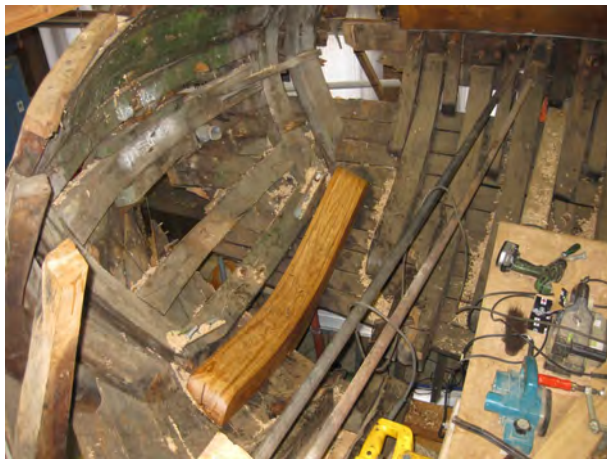
Foto links: afbeelding van het achterschip. De kielbalk is verwijderd, de romp wordt in vorm gehouden door stalen dwarsbuizen en hier en daar een nieuw spant. Hier is een echte scheepstimmerman nodig met veel ervaring en inzicht hoe dit aan te pakken. (Plus veel euro's!) Hieronder: de mastbank werd als eerste geplaatst. Het geeft de romp stijfheid in dwarsrichting. Linksonder: detail van de mastbank. Het is een genoegen dit te mogen maken.